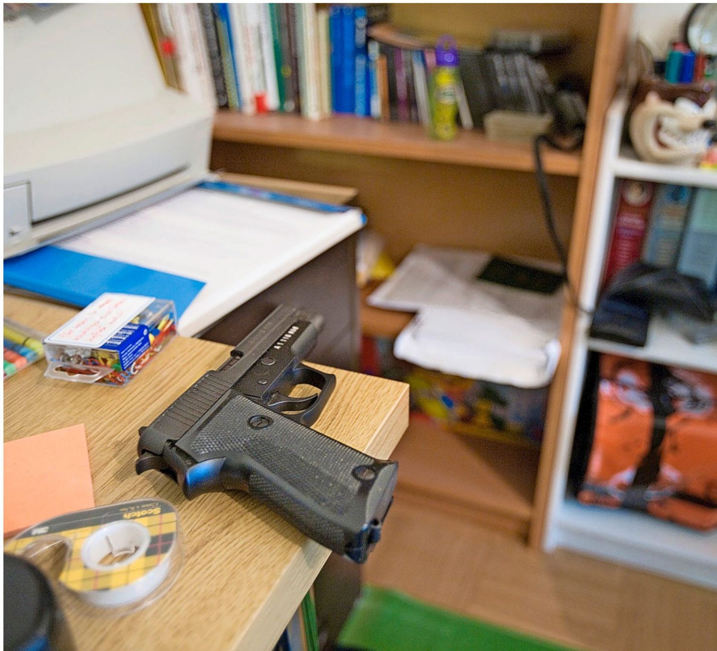
Bei einem Fünftel der Femizide in der Schweiz zwischen 2015 und 2022 waren Schusswaffen im Spiel.